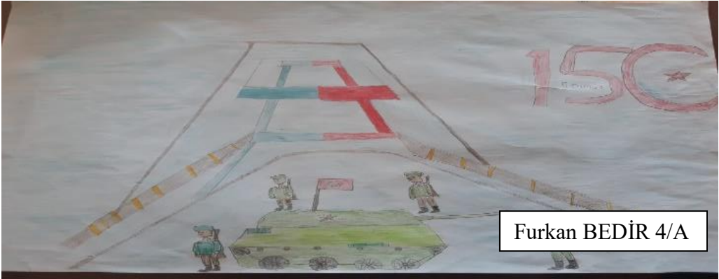
Furkan BEDİR 4/A