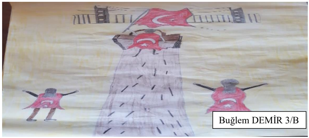
Buğlem DEMİR 3/B