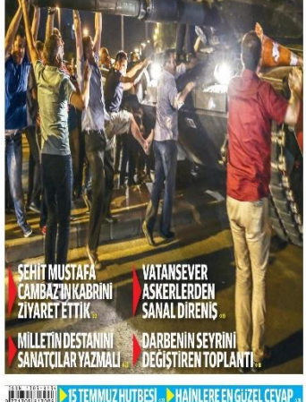
15 TEMMUZ HUTBESİ ► HANLERE EN GÜZEL CEVAP

Bir yıl önce bugün, 15 Temmuz'da, Türkiye ailesi tarihinin en ağır saldırısına uğradı. Bir yıl boyunca her Türk milleti, en acıkar anı yaşadığı geceyi hatırlıyor. Bu gece, Türkiye'nin tarihinin en büyük zaferi yaşandığı geceydi. 15 Temmuz'da, Türkiye ailesi tarihinin en ağır saldırısına uğradı. Bir yıl boyunca her Türk milleti, en acıkar anı yaşadığı geceyi hatırlıyor. Bu gece, Türkiye'nin tarihinin en büyük zaferi yaşandığı geceydi.