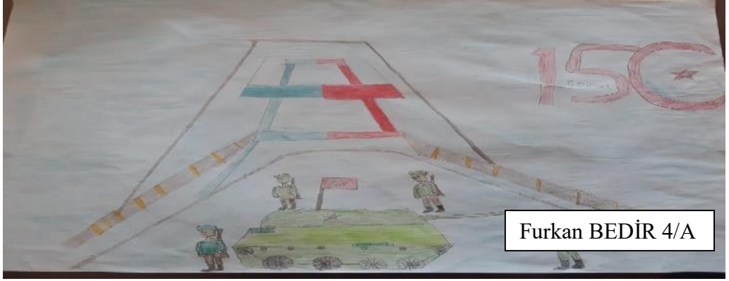
Furkan BEDİR 4/A