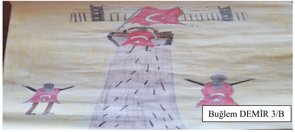
Buğlem DEMİR 3/B